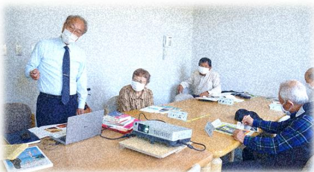
【「自分史づくり講座」の様子】