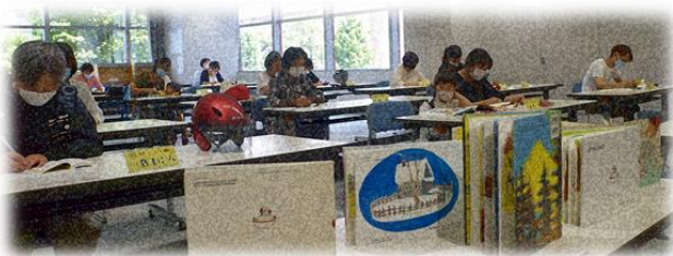
【「絵本とわらべうた講座」の様子】

12月まで全8回の講座です。初回は、「ぐりとぐら」や「三びきのやぎのからがらどん」などを例に、作品の魅力や読み聞かせをする際のコツを教えてくださいました。学んだポイントを家庭や学校、地域、職場などでの読み聞かせに活かしてほしいと思います。