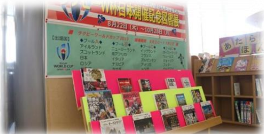
【「ラグビーW杯日本開催記念図書展」の様子】

そこで、市立図書館ではラグビーや出場国に関する本を集めた企画展を開催中です。ラグビーのこと、選手のこと、出場国のことを知って、ワールドカップを観戦しましょう！