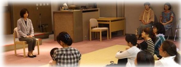
【ストーリーテリングの様子】

8月3日、図書館フェスタの中で、ストーリーテリング講座の受講者の発表会を行いました。「おおきなかぶ」や「ふるやのもり」など、7つのおはなしが語られました。語り手の言葉から想像をいっぱい膨らませて、おはなしの世界を楽しみました。