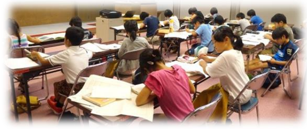
【「読書感想文書き方教室」の様子】

今年の「読書感想文書き方教室」は、3日間で60人の参加がありました。午前中は、感想文に書く内容や構成の工夫について学び、午後はメモをもとに文章を組み立てる作業を行いました。午前10時から午後5時までの長時間に及ぶ講座でしたが、子どもたちは集中を切らさず、感想文を書き終えることができました。