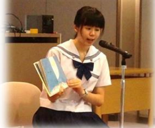
【「平和の祈りおはなし会」の様子】