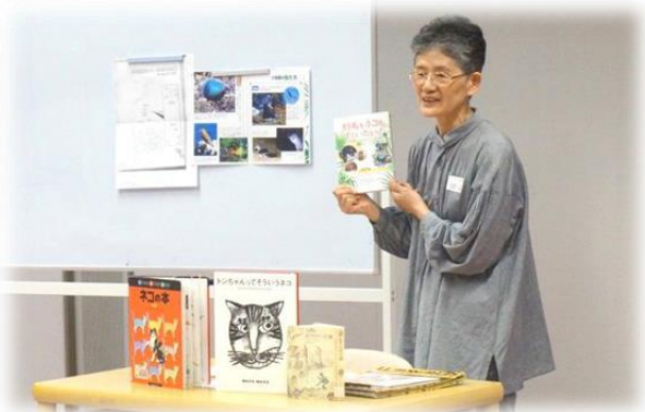
【ブックトークの様子（ブックトーク講座から）】

また、学校等からの申請を受けて、ブックトークの実演を行う講師の派遣も行っています。詳しくは当館までお問い合わせください。