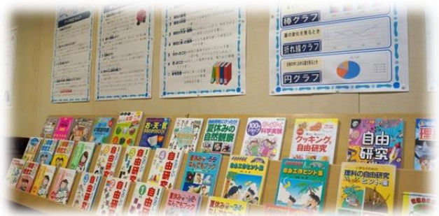
【夏休み自由研究参考図書展】

企画展は8月末までの開催ですが、貸出が集中することも予想されます。なるべく早めにお越しください。