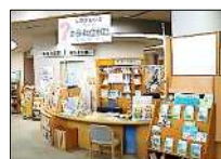
①レファレンス(サビ)カウンター