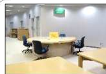
⑥パソコンコーナー