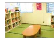
④赤ちゃんえほんのへや