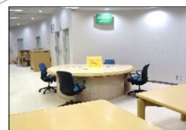
⑥パソコンコーナー