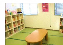
④赤ちゃんえほんのへや