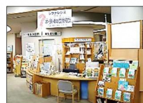
①レファレンス(サービス)カウンター