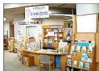
①レファレンス(サービス)カウンター