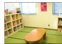
④赤ちゃんえほんのへや