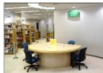
⑥パソコンコーナー