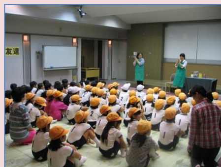
「来館学習」の様子。アラの読み聞かせを聞いています。読み聞かせの実施には要相談です。