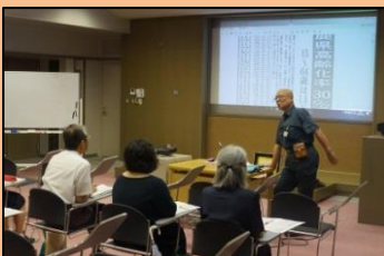
「防災セミナー」の様子。南海トラフ地震が発生した時の津波の到達シミュレーションなどを見せました。

今後は、第3回を11月11日(土) 14時から「医療セミナー 糖尿病」、第4回を2月10日(土) 時間未定「歴史セミナー 薩長同盟そのあと(仮題)」を計画しております。多くの市民のみなさんの受講をお待ちしております。