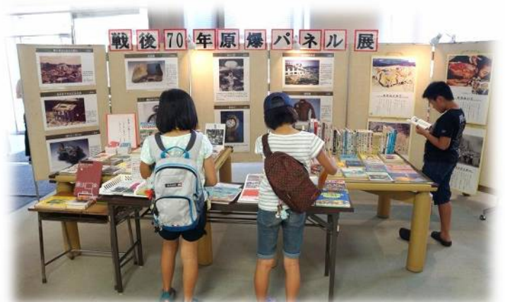
【開催中の原爆パネル展】