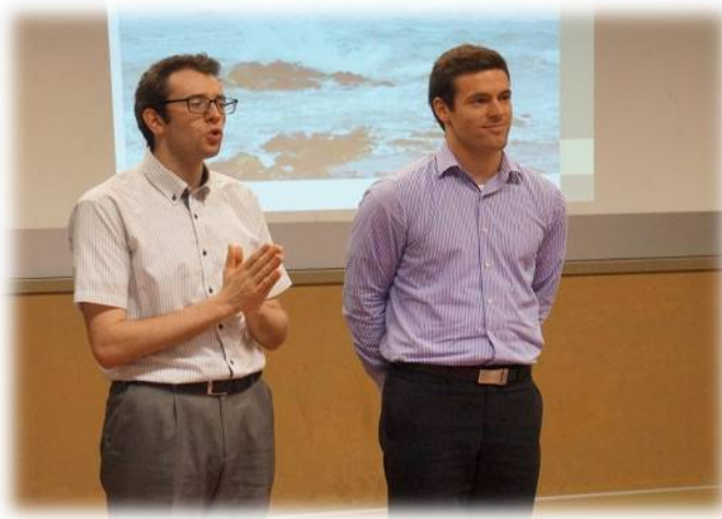
【英語でメッセージを送るALTの先生】 「英語をもっとたのしみましょう!!」